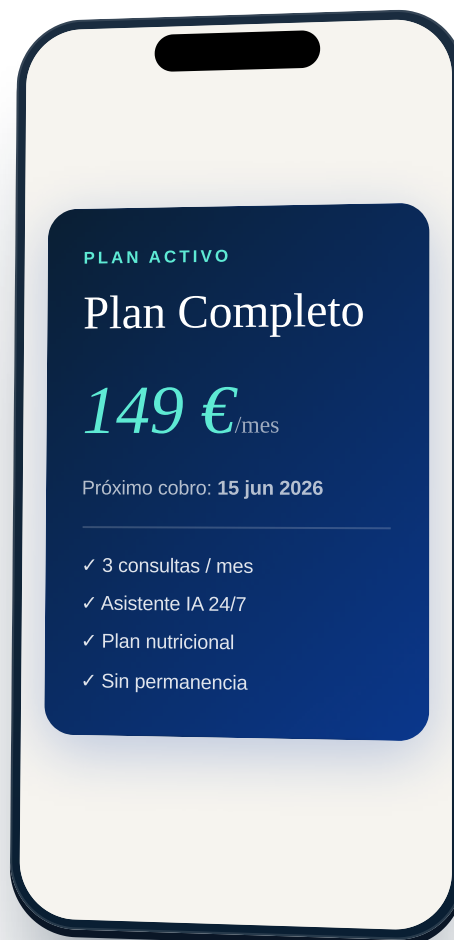
Detalle del plan · precio y fechas

Si tienes una suscripción activa, aparece arriba destacada. Toca encima. Verás detalles: precio, próxima factura, opciones de cambio.