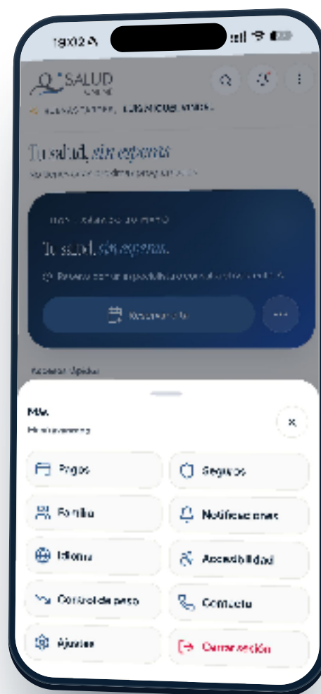
Menú avanzado · accesos a ajustes

En la pantalla de inicio, toca los tres puntos «⋮» del bloque «Tu salud, sin esperas». Se abre el menú avanzado con todos los ajustes.