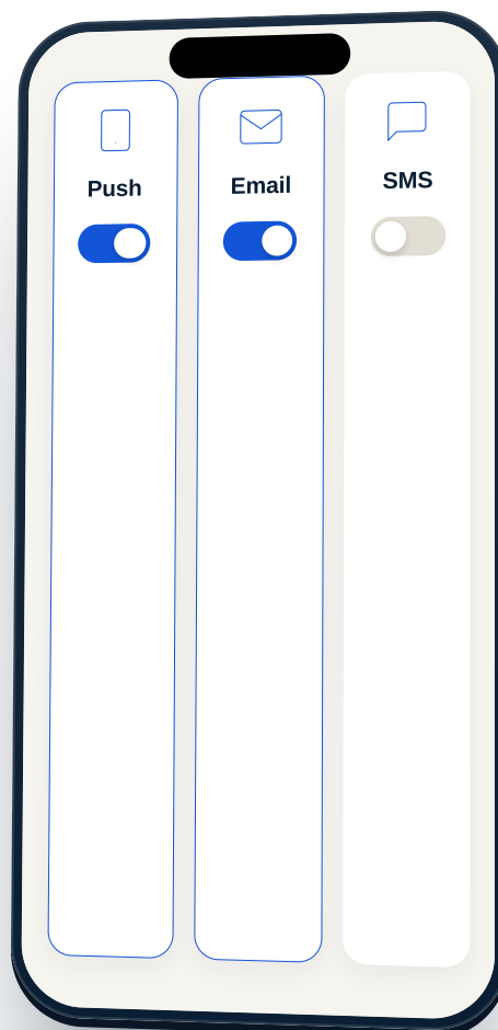
Push · Email · SMS · por canal

Tres canales independientes: Push (en el móvil), Email , SMS . Activa los que prefieras. Nuestro consejo: push + email para citas, SMS solo para urgencias.