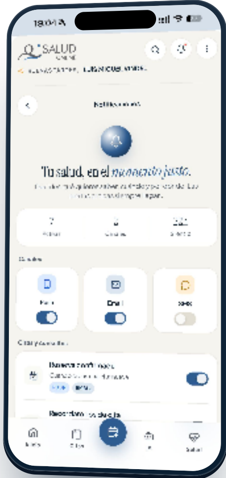
Pantalla de ajustes de notificaciones