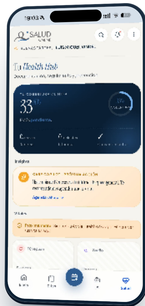
Tu Health Hub · documentación y vitales

En la barra inferior toca Salud . Aterrizarás en tu Health Hub: cobertura clínica, recetas activas, informes y vitales.