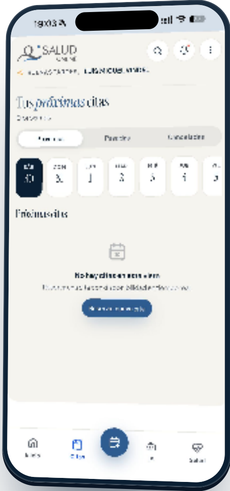
Calendario semanal · tus próximas citas