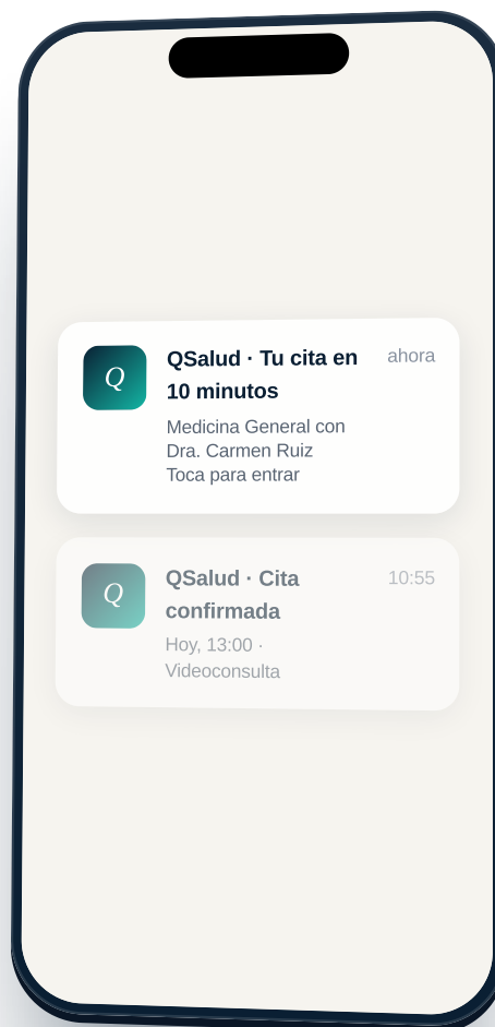
Push + email · 10 min antes de tu hora

Te llega una notificación push y un email recordándote la cita. Si tocas la notificación, te lleva directamente a la pantalla de la consulta.