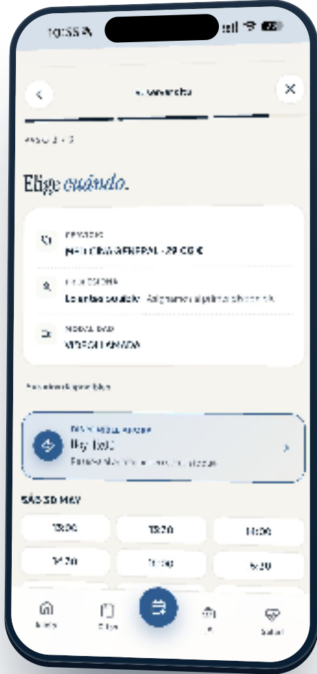
Paso 3/3 · Horarios disponibles en tiempo real