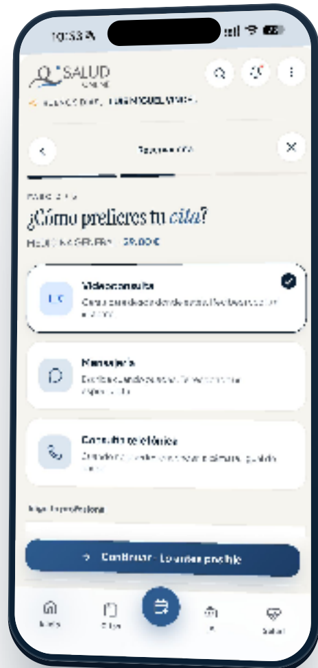
Paso 2/3 · Videoconsulta · Mensajería · Teléfono

Videoconsulta (lo más habitual), mensajería asíncrona o consulta telefónica. La videoconsulta dura 15-20 minutos y te llega la receta al instante si procede.