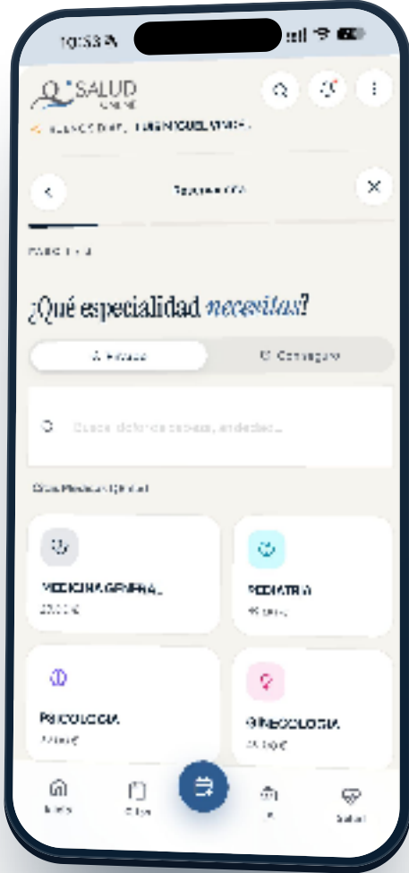
Paso 1/3 · ¿Qué especialidad necesitas?