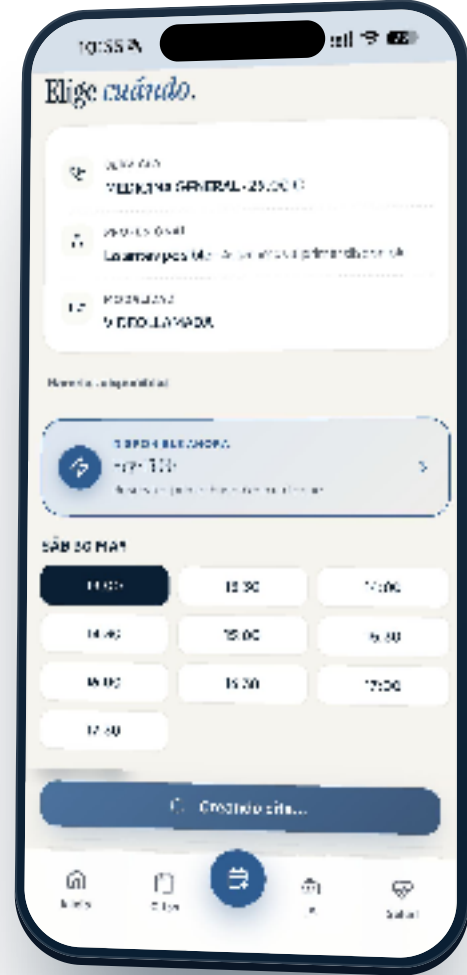
Confirmación · cita creándose

Tocas el hueco que quieres y confirmas. Te llega notificación push con el resumen de tu cita y un recordatorio 10 minutos antes . Listo. Solo queda esperar tu turno.