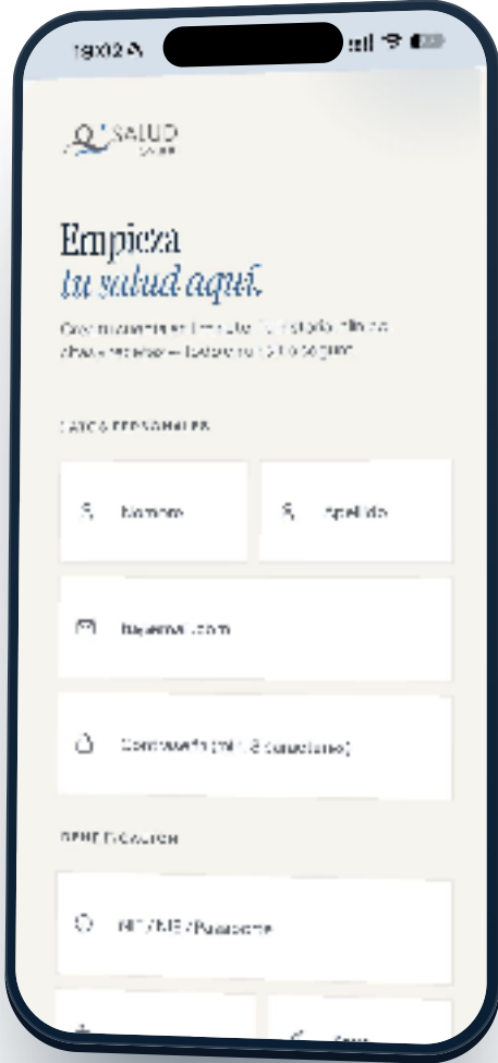
Datos personales + identificación