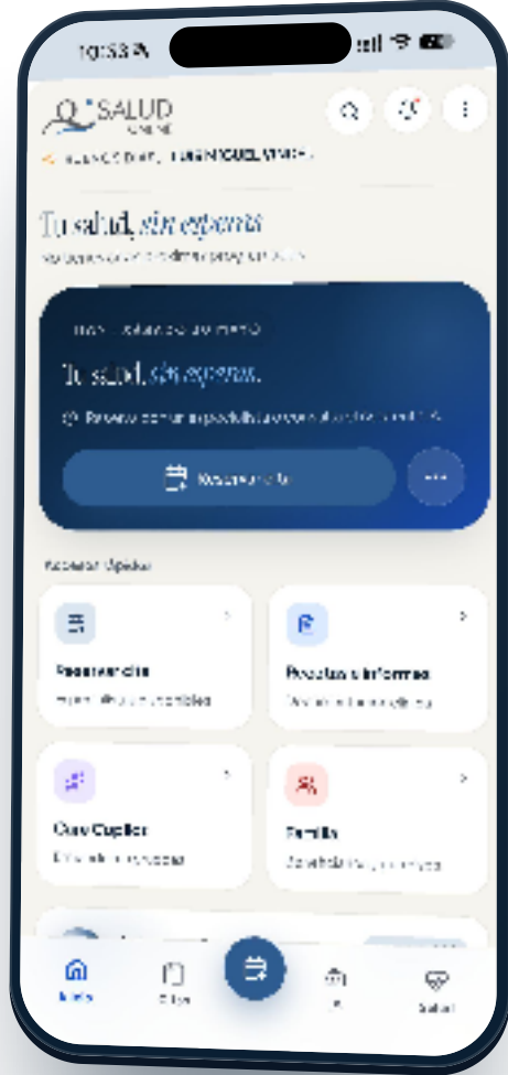
Pantalla de inicio · «Tu salud, sin esperas»