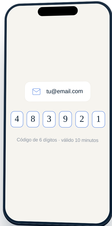
Código de 6 dígitos · válido 10 minutos

Te enviamos un código de 6 dígitos al email que pusiste. Ábrelo y escríbelo en la app. Si no lo ves, revisa el spam o pídelo otra vez tocando «Reenviar».